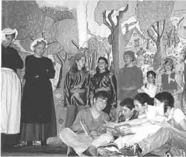
"El clan de los valientes" por Virgen Niña, año 1997

"El clan de los valientes" , escrita en clave de cuento, es, además, una obra para ejercitar la imaginación de los niños, no sólo de los que la interpreten, sino también de los pequeños espectadores.