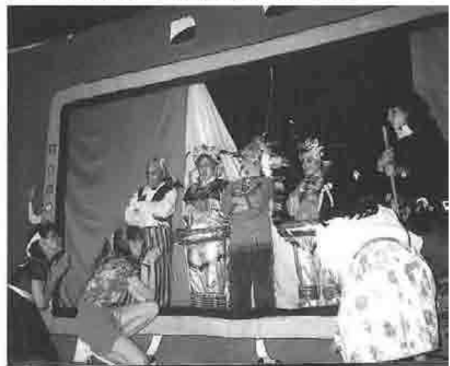
"Sentado te engorda el cu..." por San Viator, año 1995

Es una de las cualidades de Ramón García, conocedor de los gustos infantiles, como bien lo demuestra en su extensa obra, tanto en teatro infantil como en narrativa. Son muchos los libros que ya tiene publicados con gran aceptación entre los chavales. Refleja en su obra los gustos, la rebeldía, la solidaridad, en definitiva, la personalidad de los niños en sus primeros años de vida.