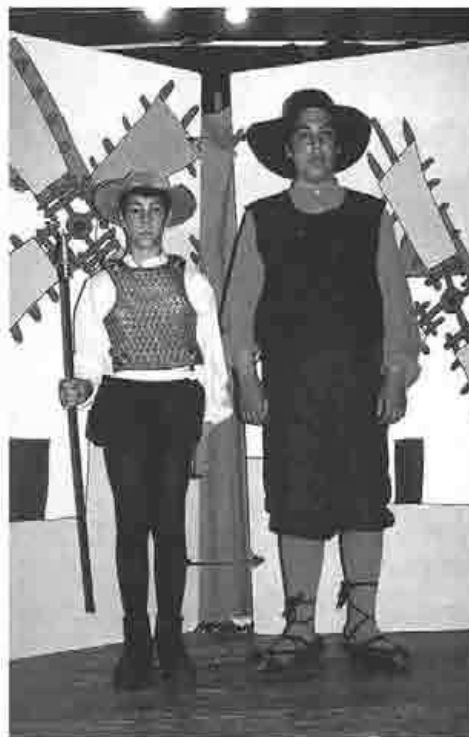
Personajes de "La Ínsula Barataria", año 2002