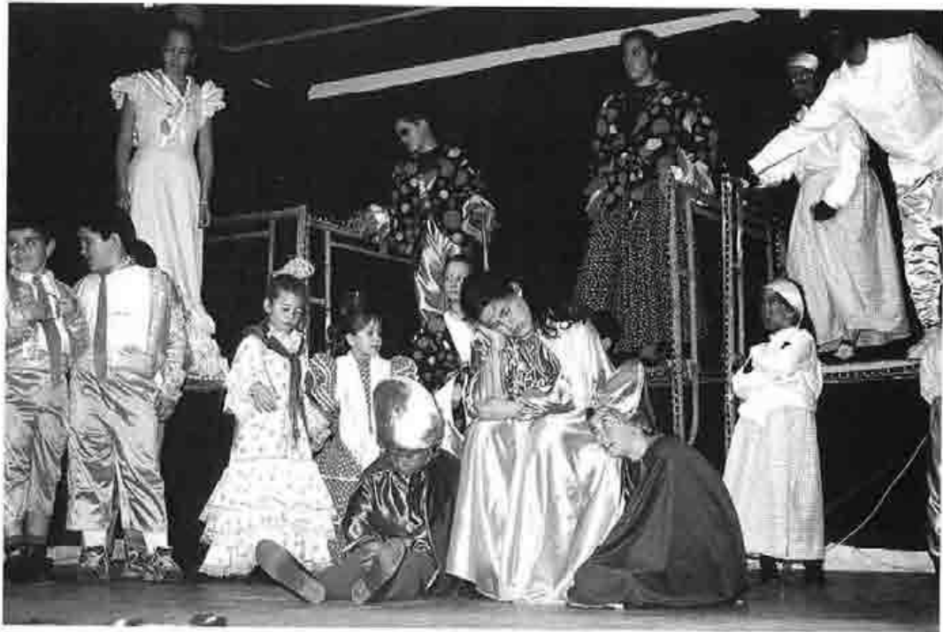
"Érase una vez la revolución..." por La Trujana, año 2002

fundizar en la pasión que despierta el escenario por encima de los míseros sueldos, en la lucha del actor por alcanzar un aplauso y de la del director por alcanzar un actor. , y en como, a pesar de terminarse la subvención, había seguido yo dirigiendo a ese grupo de la tercera edad empeñado en representar Maribel y la Extraña Familia .