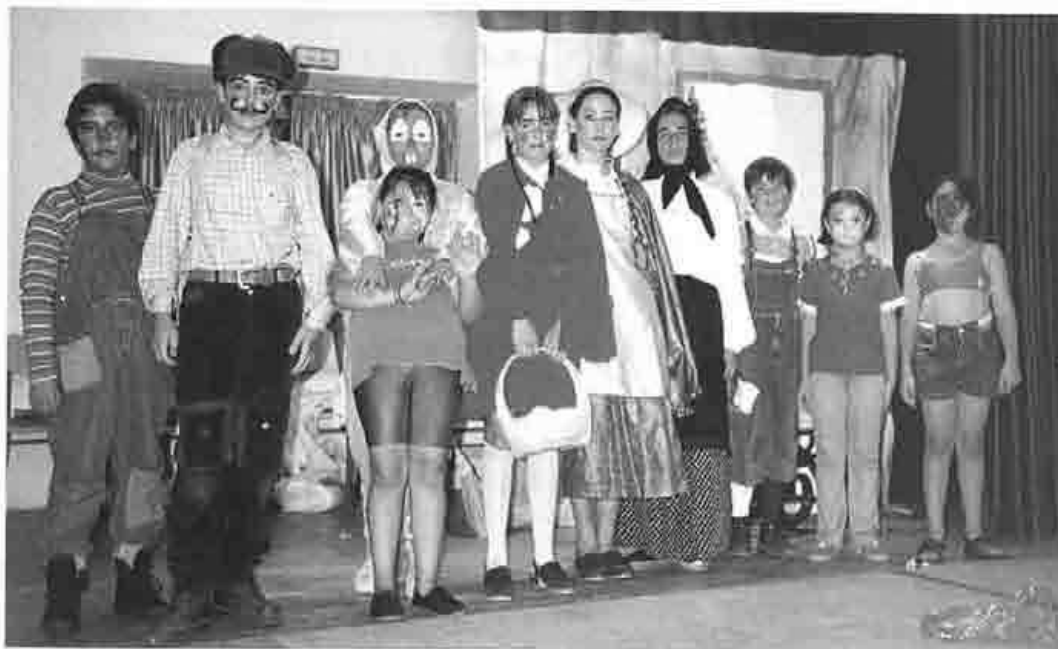
"Caperucita Roja" por el Grupo Miguel Delibes, año 1998