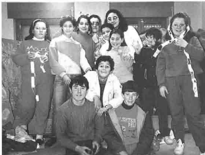
Taller de teatro de Mingorría, año 1989

En tercer lugar, el hacer teatral dignifica el alma humana y prepara al cuerpo para expresarse desde el fingimiento que supone la teatralización.