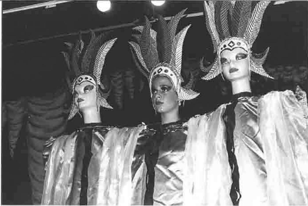
"La Gran Aventura" por el Grupo San Francisco de Asís, año 2001

Desde mi punto de vista, y sin querer agotar todas sus virtualidades educativas, el teatro escolar sirve para: