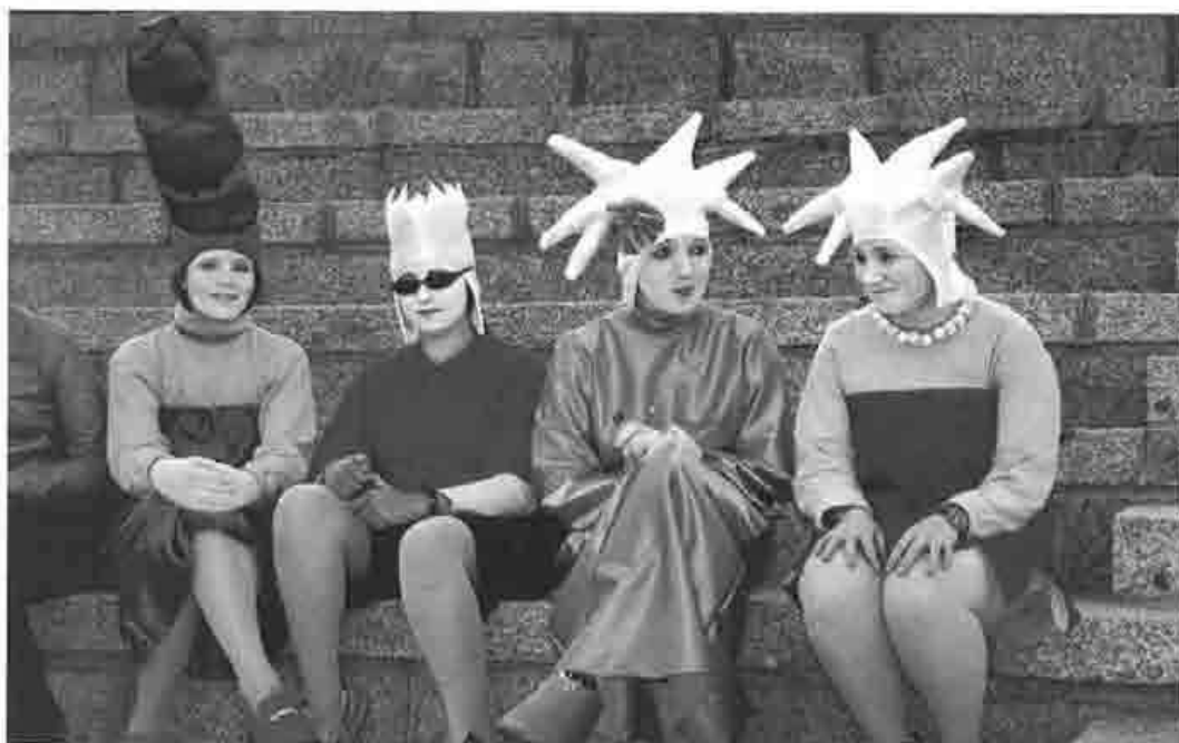
Escena Carnavalesca, año 2000