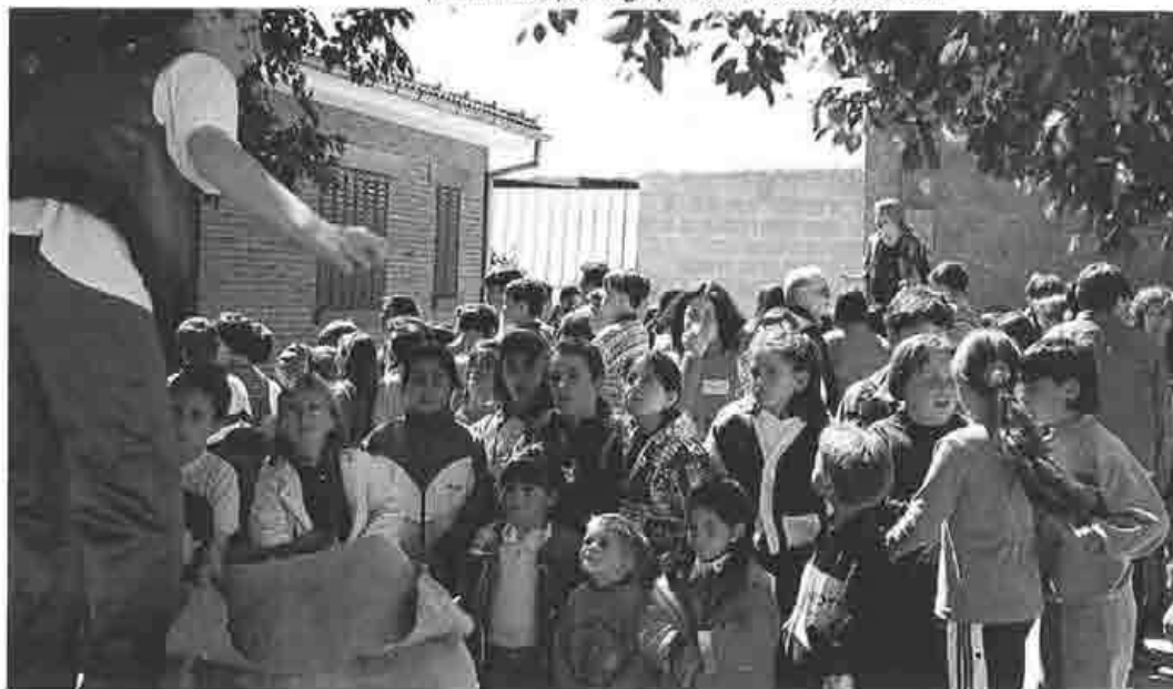
"¡Catacroc!", por el grupo Santa Teresa, año 1996

Durante dos cursos dirigí el Taller de Teatro y pusimos en escena con cierto éxito dos obras: "Caperucita Roja" y "El disparatado rodaje de la Bella Durmiente". Mi objetivo durante ese tiempo fue que los niños y niñas disfrutasen con el teatro y afrontasen de forma positiva la lógica presión que supone el participar en un Certamen Nacional".