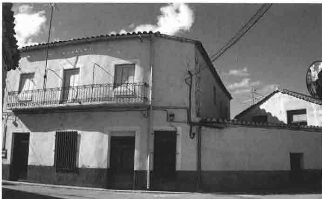
Edificio del antiguo Salón de Teatro construido por Simón Vázquez