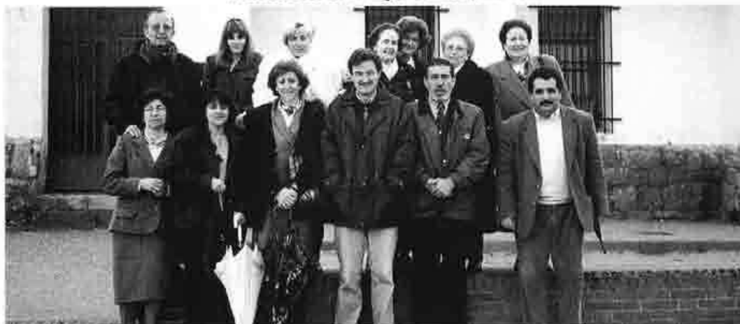
Profesores del CRA "Miguel Delibes", año 1996

Para finalizar, gracias a todos, porque con vuestro esfuerzo habéis conseguido que mucha gente haya sido feliz a través del teatro. De una manera especial mi agradecimiento y recuerdo para todos los compañeros que durante estos diez años ha pasado por el CRA, y como decía un buen amigo mío "el teatro es cultura, y la cultura define a un pueblo".