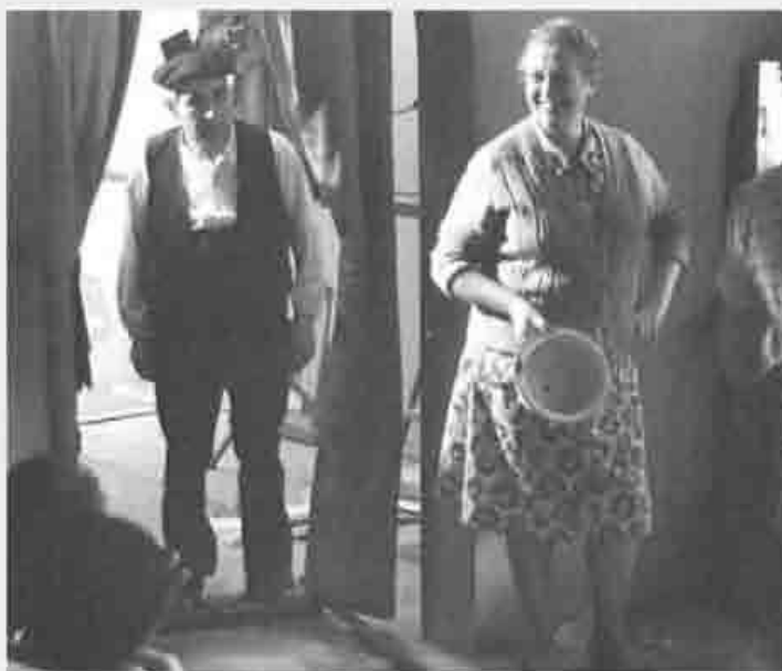
Escena de "La Conversión", filmada por Antonio Gutiérrez