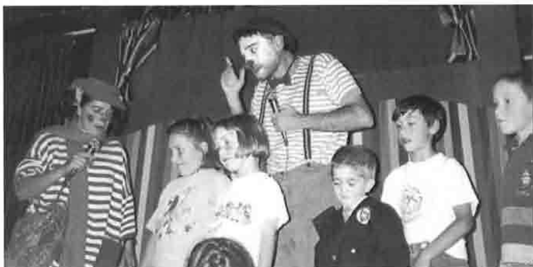
"Chiribamba animación", año 1998