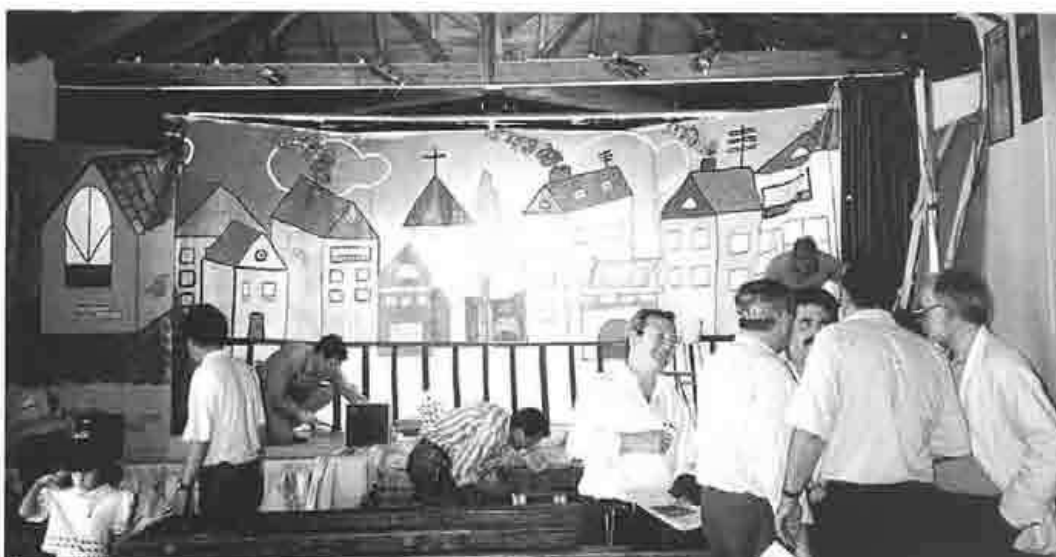
Sala de Teatro "Las Pozas", año 1994

Y dicho esto, como hablamos de teatro y escuela rural, conviene señalar, por si alguno piensa todavía que aquél es actividad marginal y poco útil, algunos de sus muchos valores educativos. Es cierto que nunca, para nuestra desgracia como maestros y como alumnos, el arte (sea plástico, musical o dramático) tuvo en la escuela predicamento. El calificativo de "marías" con el que se designaban estas asignaturas da la idea exacta de la importancia que se les ha dado y, creo, que se les sigue dando. La escuela ha hecho así ciudadanas y ciudadanos semiparapléjicos, cabezas llenas, tal vez, algo lógicas pero ayunas de emociones. Ahora que está de moda hablar de la inteligencia emocional, bueno será echar mano de una herramienta como el teatro que, a fuer de viejo, tiene en sí toda la experiencia del tiempo.