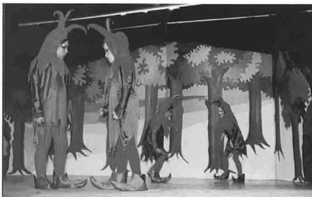
"La gran aventura", por el Colegio San Francisco de Asís (Valladolid), año 2001