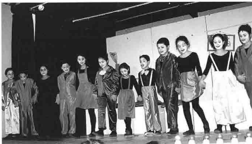
"Ensalada de bandidos", por La Trujana, año 2000

Una idea brillante surgió de entre las tostadas, no se si antes o después de untar la mantequilla. Mi artículo versaría sobre el proceso psicológico en virtud del cual el teatro favorece la integración sociocultural del sujeto dotándole de una estabilidad emocional que eleva su autoestima mediante la afloración en su ego de un nivel óptimo de autonomía.