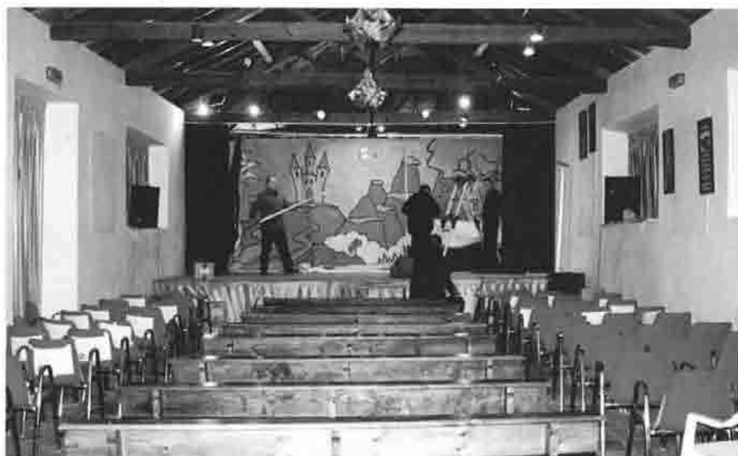
Sala de teatro "Las Pozas"